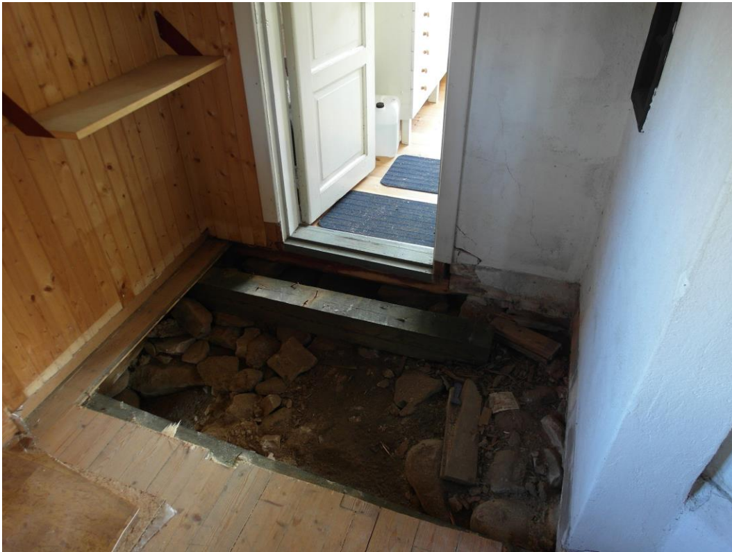
Före åtgärder: Riven del av golvet mot köket och murstock.