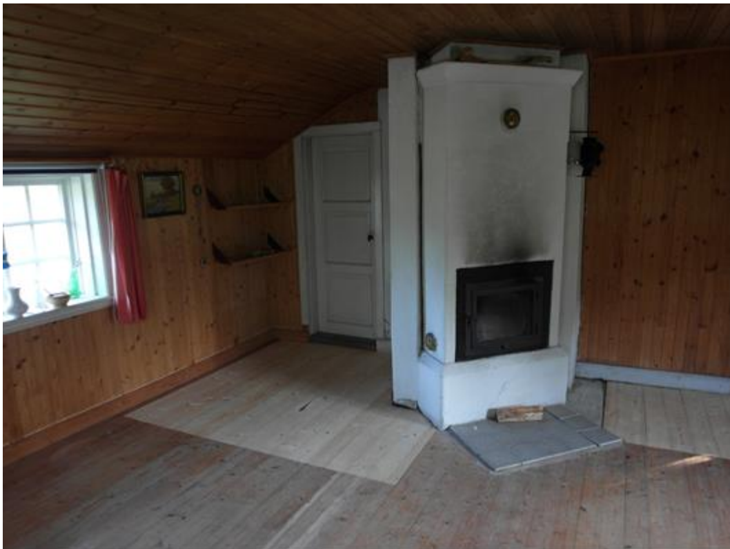
Efter åtgärder: Golven färdiglagda och klara.