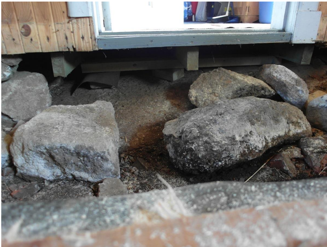
Före åtgärder: Berg, stenmaterial och jord ligger nära golvnivån.