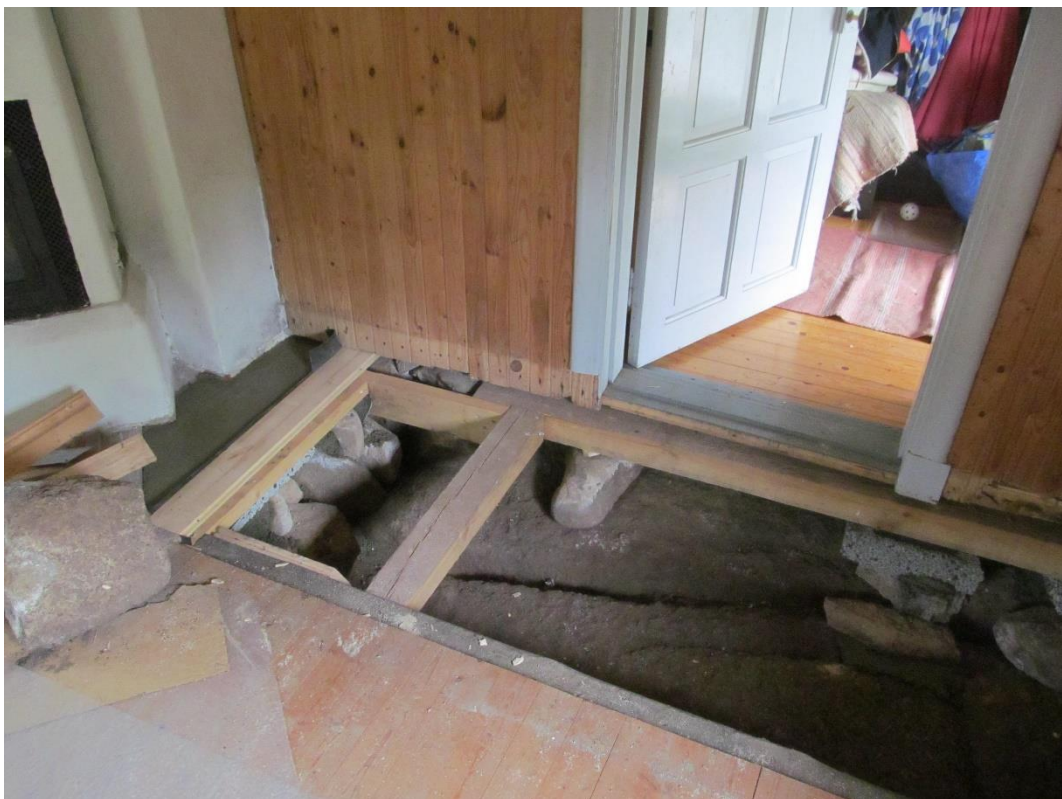
Under arbete: spontade golvbrädor börjar läggas i utrymmet mot förstugan.