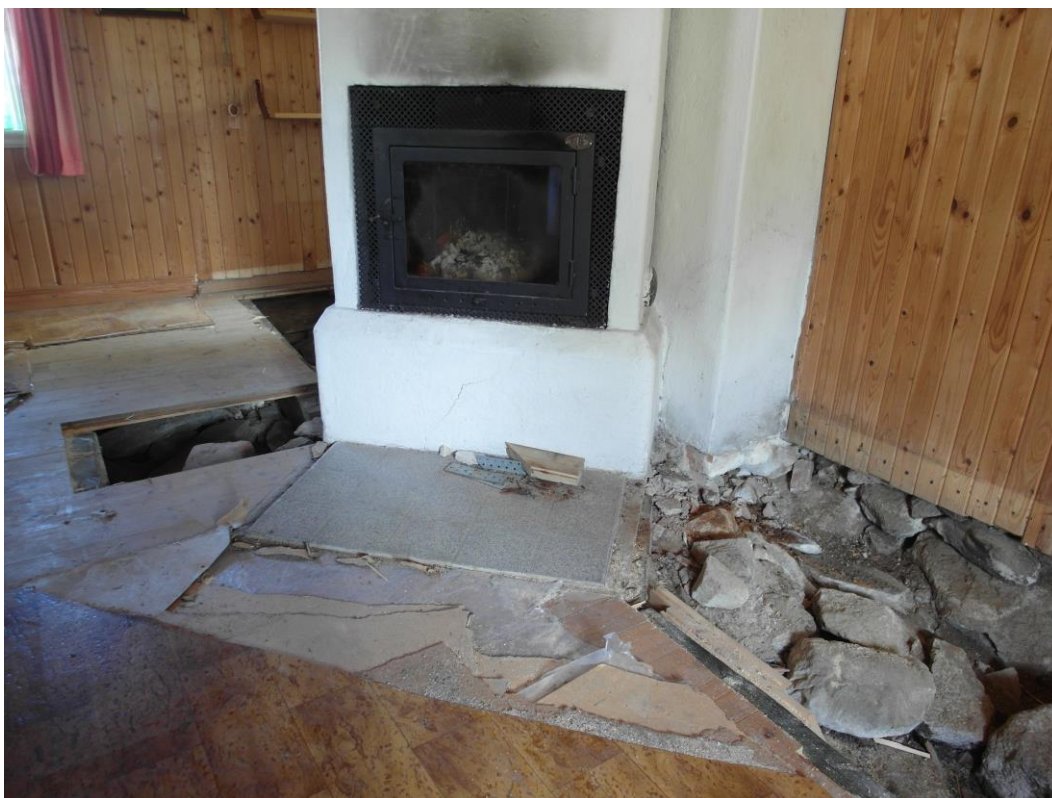
Före åtgärder: Golvet rivet på de två ställen i rummet mest skador noterats.