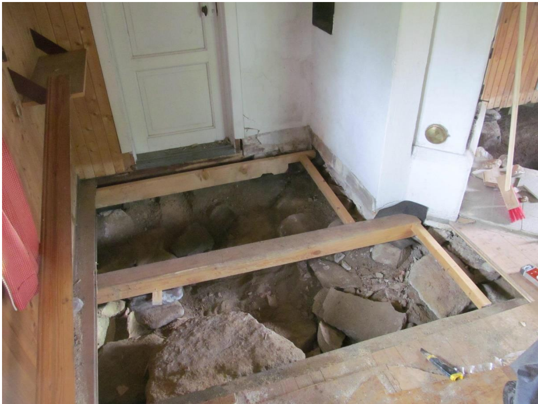
Under arbete: så mycket som möjligt är material bortrensat i grunden och nya golvbjälkar på plats i utrymmet mot köket.