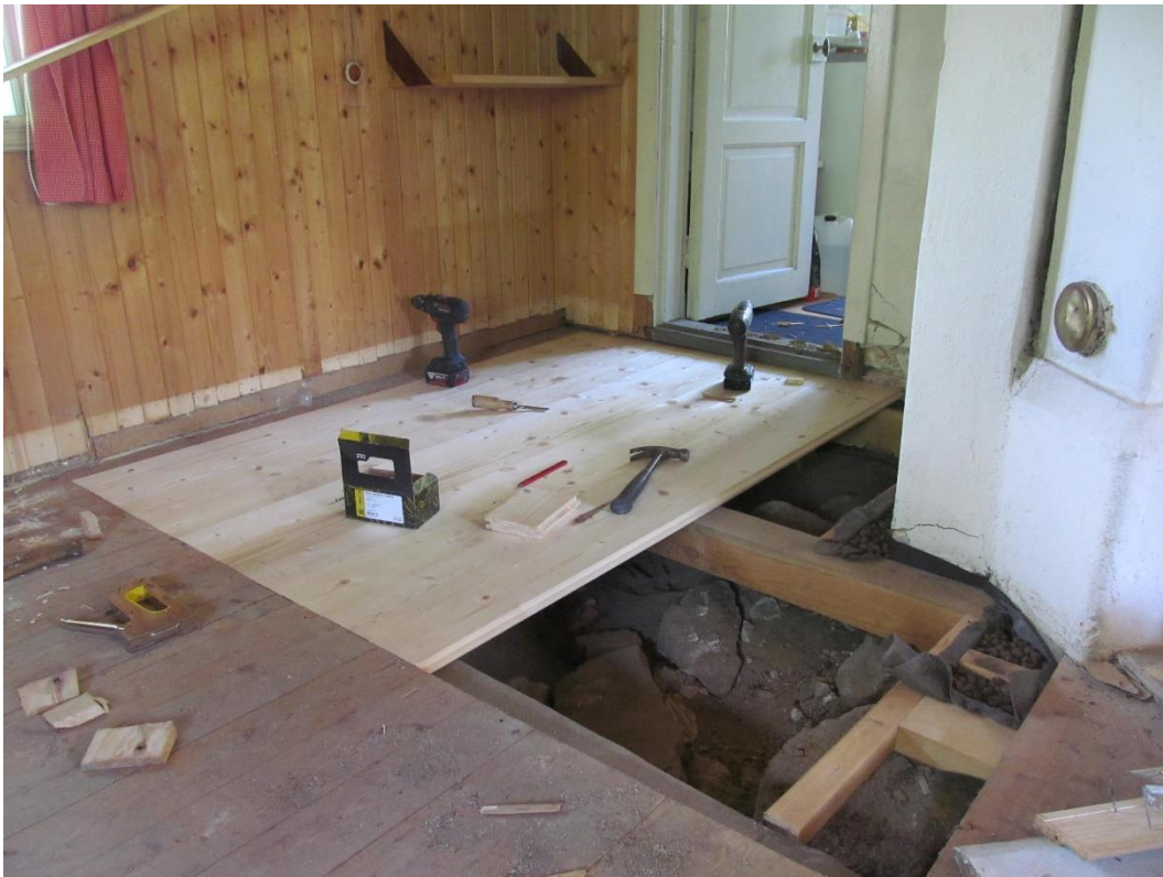
Under arbete: Golvet börjat läggas i utrymmet mot köket. Närmast murstocken har utrymme fyllts upp med lecakulor.