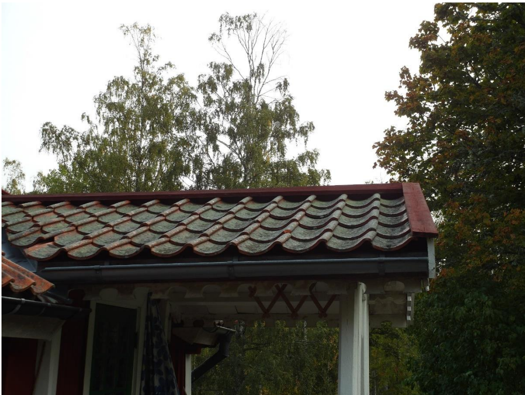
Tak före och efter åtgärder. Alla vatt- samtnockbrädor ersattes med nya.