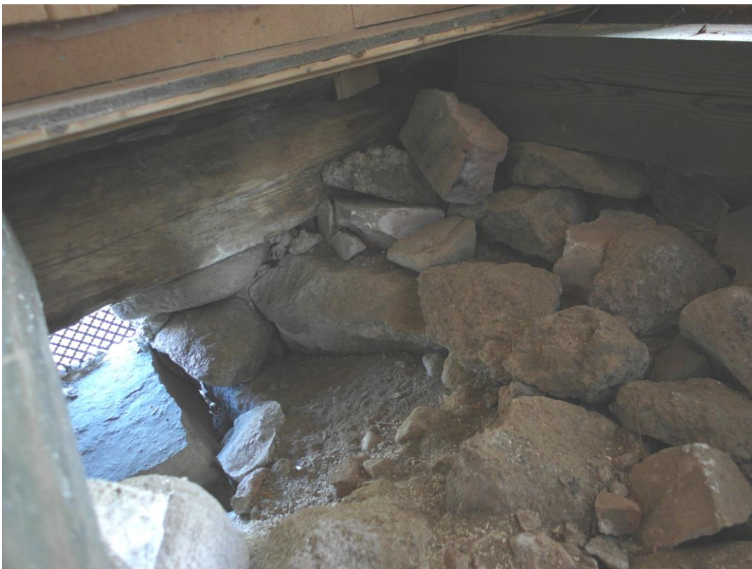
Före åtgärder: Syllen ligger direkt mot sten och mark.