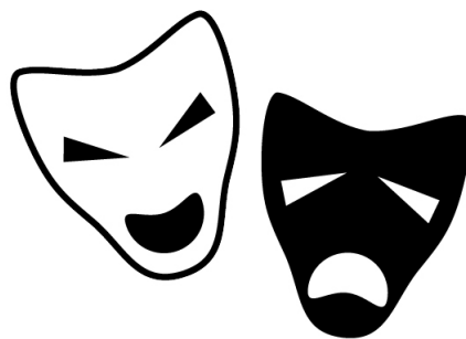
Bild och form

Ett tips är att göra enkla gestaltningar på temat känslor – dra lappar ur en hatt och låt sedan alla samtidigt gestalta samma känsla. Då blir det mindre känsligt när alla gör det, och det blir också tillfälle att prata om varför man kanske visar samma känsla på olika sätt.