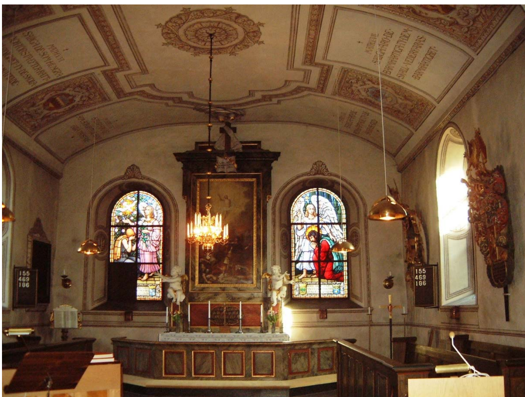
Norra korsarmen.