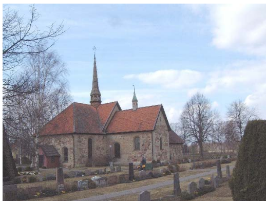
Veta kyrka från sydöst. Foto Östergötlands museum 2005.

Veta kyrka uppfördes troligen under 1100-talet eller tidigt 1200-tal. Koret utökades på 1300-talet och sakristian byggdes på 1400-talet. De tidigaste kalkmålningarna i kyrkan utfördes troligen något efter kyrkans uppförande. Kalkmålningar finns även från två perioder av 1400-talet då kyrkan valvslogs, från 1500-talet och från tidigt 1900-tal. Under 1600- och 1700-talen tillkom den södra respektive norra korsarmen. Kyrkans ursprungliga delar byggdes i kalksten och övriga delar är i gråsten med inslag av kalksten, bl a delar av den äldsta kyrkans profilerade sockel. Fasaderna står idag oputsade och taken är täckta med tegel. Kyrkans huvudingång är genom det sentida vapenhuset i söder. Det finns en del medeltida öppningar synliga i fasaden, men i övrigt är fönstren och västportalen från en omfattande restaurering 1913-14. Även interiören präglas av denna restaurering liksom av de medeltida valven och målningarna.