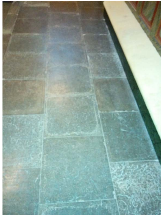
Det nya kalkstensgolvet har lagts och som jämförelse visar bilden till höger det befintliga golvet utanför altarringen.