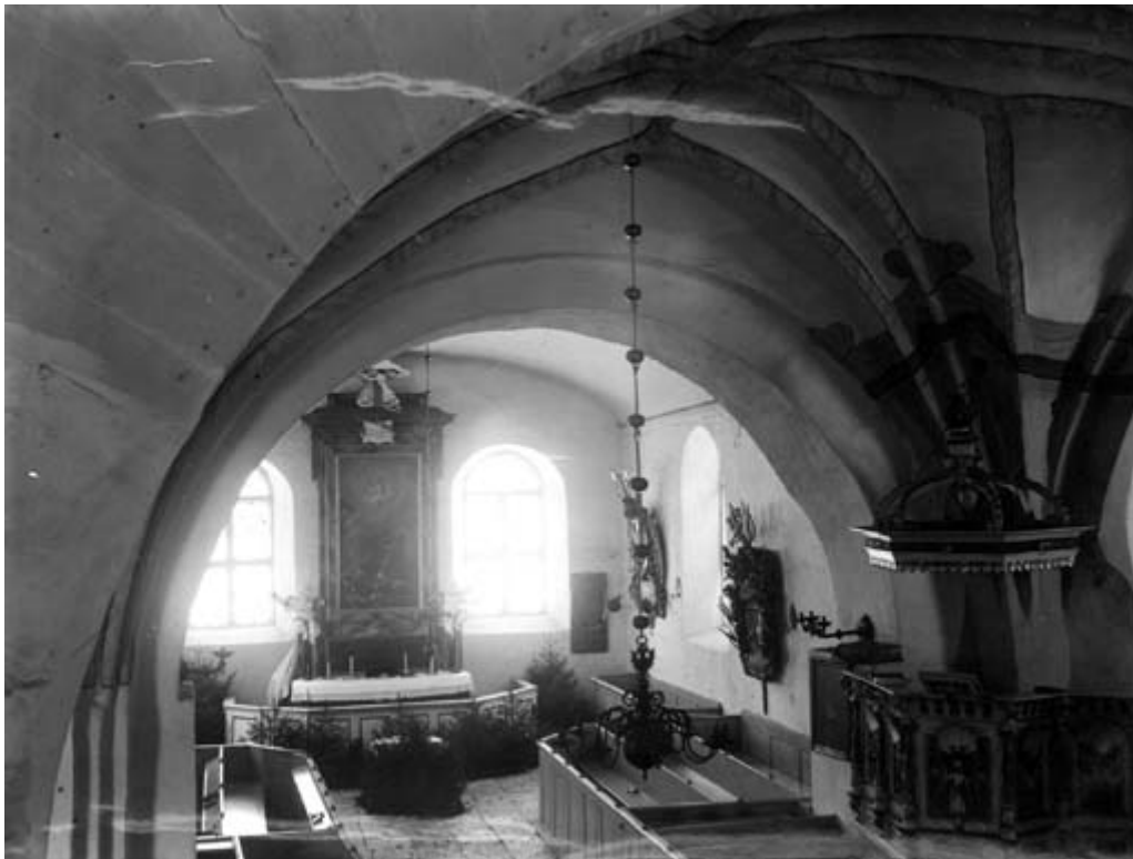
Norra korsarmen 1895.