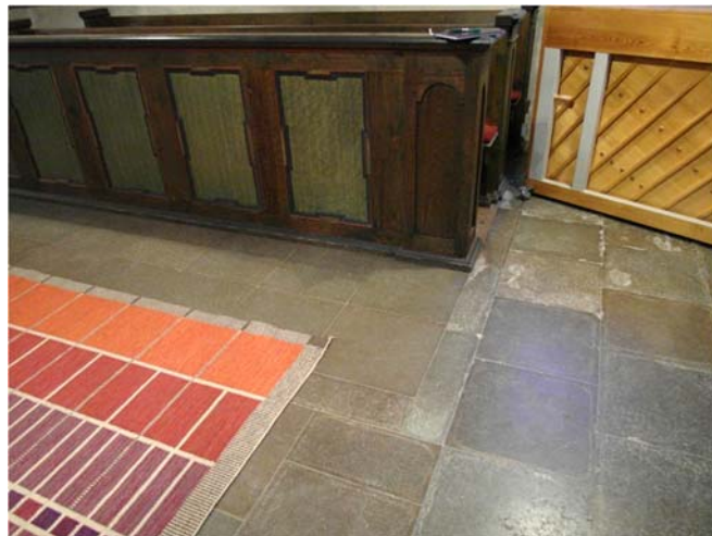
T v: Övergång mellan det nya golvet och befintligt golv. I bakgrunden syns norra väggen (korsväggen). T h: exempel på äldre stenarbete. Vid någon av 1900-talets renoveringar har bänkar tagits bort i norra korsarmen, se foto under Beskrivning och historik. En smal stenfris i golvet markerar detta.

Under orgelläktaren slipades både kalkstens- och trägolv. Trägolvet behandlades med Osmo Oljebets, brun. Därefter lade man på Osmo Hårdvaxolja Originalet 3062, ofärgad matt.