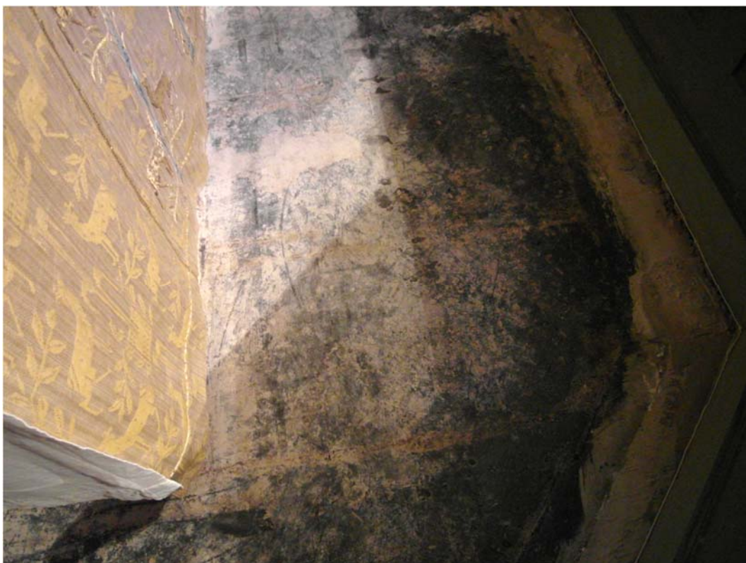
Textilmattan, som var limmad på en skiva, har tagits bort.