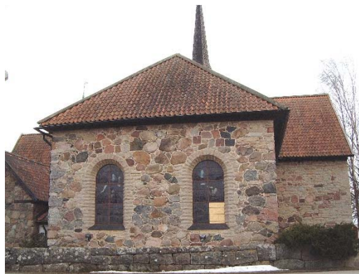
Norra korsarmen.

Hela norra korsarmen är utformad som ett kor med huvudaltaret längst i norr. Korgolvet är täckt med kalkstensplattor. Altaret är murat, troligen breddat, med en front av slammat tegel. Den sentida altarskivan är av polerad kalksten med huggna konsekrationsskors. Altarringen är flersidig och har bandgångjärn till dörrarna, som inte längre används. Den är marmorerad i grönt med röd och förgylld markering runt speglarna. Även överliggaren har samma typ av bemålning. Altarringen har 1700-talskaraktär. Altartavlan från 1761 föreställer Kristi uppståndelse och himmelfärd. Konstnären är okänd.