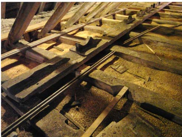
Den medeltida styrbrädan förvaras på vinden.

Bland annat det medeltida murverket och den romanska takstolen är värdefulla för förståelsen av kyrkans ursprungliga utformning samt viktiga källor till kunskap om medeltida byggnadsteknik. Långhusvindens rester av kalkmåleridekor från såväl 1400-tal som 1700-tal är viktiga delar av kyrkans historia.