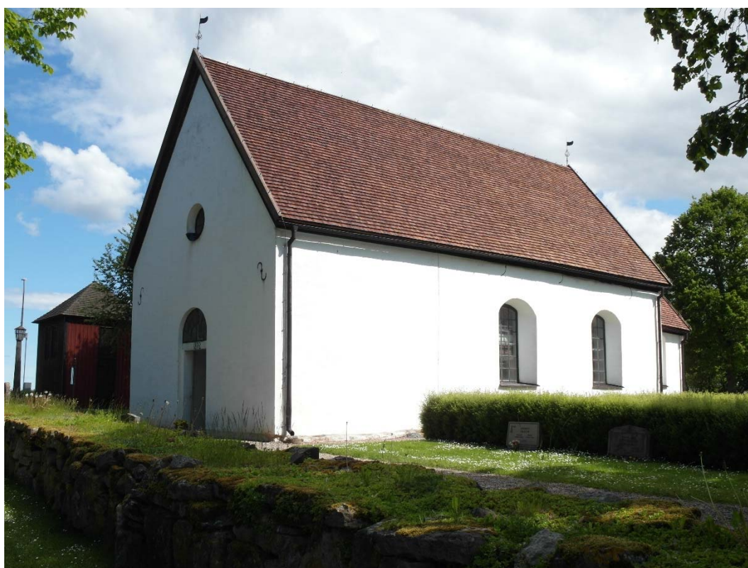
Kumla kyrka från sydväst.

Där 1800-talets takstolar gränsar till de medeltida takstolarna har man haft problem med rörelser i taket. Det har bildats en springa i taktäckningen frånnock ner till takfot både på södra och norra takfallet. Även på fotografier från tidigt 1900-tal kan man se en tydlig ”rand” från tacknock och ner utmed norra takfallet. För att försöka komma till rätta med detta monterades 2001 en fribärande takstol intill den västligaste medeltida takstolen och taktron byttes ut över takstolen. Ovanpå taktron lades här en plåtavtäckning, förankrad i en sida, och däröver takspånet. På södra sidan lades nytt spån över lagningen, men på norra sidan återanvändes huvudsakligen det äldre spånet. Samtliga takytor, även klockbodens spåntak, tjärades. (Besiktningssytrande Östergötlands länsmuseum, 2001-11-16 dnr 703/00).