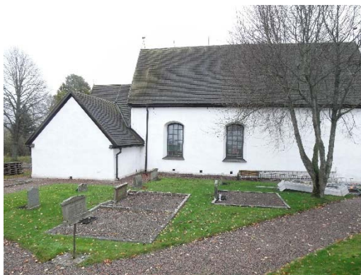
Norra sidan före omtäckning.