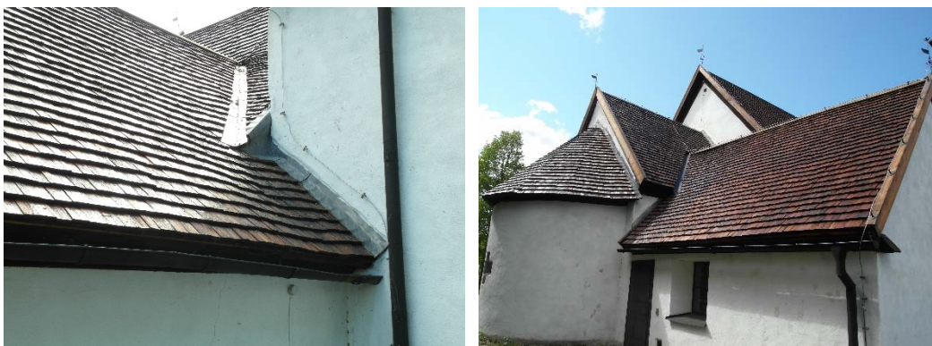
Anslutning av blyplåt mellan sakristian och norra långhusväggen.

kortaket, utan rännadal. En återgång till detta diskuterades nu, men det beslutades att lägga en rännadal av plåt, då det troligen minskar risken för läckage. Nya rännadalar lades med Rukki Kulturplåt, 0,6 mm tjock, och målades med Isoguard pansar och slutstrykning med linoljefärg. Återmontering av åskledare.