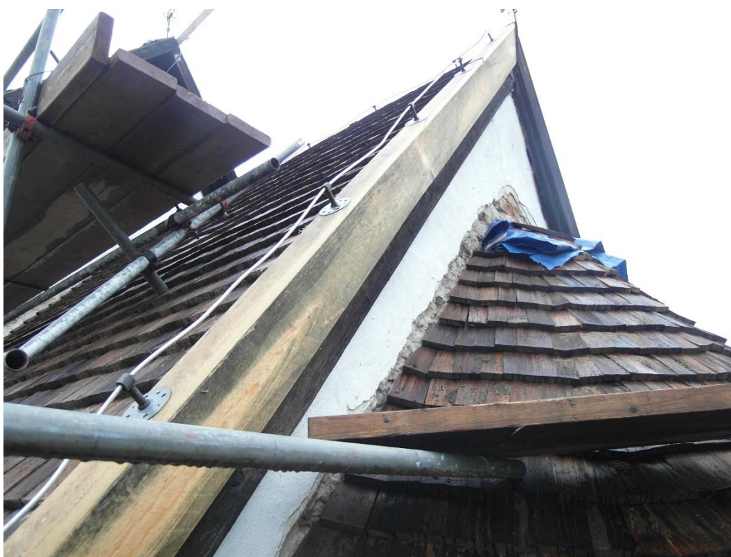
Vid fototillfället var nytt spån lagt på absiden och kortaket. Nya vindskivor och täckbrädor var monterade. Plåtanslutningen absidtak/korvägg återstod att göra.

Nya anslutningar mot fasaden gjordes med 2 mm tjock blyplåt. De ersatte tidigare plåtar. Även i anslutningen mellan sakristians och korets tak låg rännदार av plåt. På ett äldre fotografi såg det ut som om sakristians spåntak anslöt direkt till