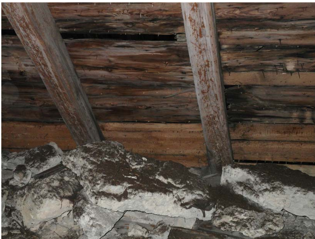
Lagat parti vid takfoten.

Endast mindre ytor av taktron behövde bytas ut.