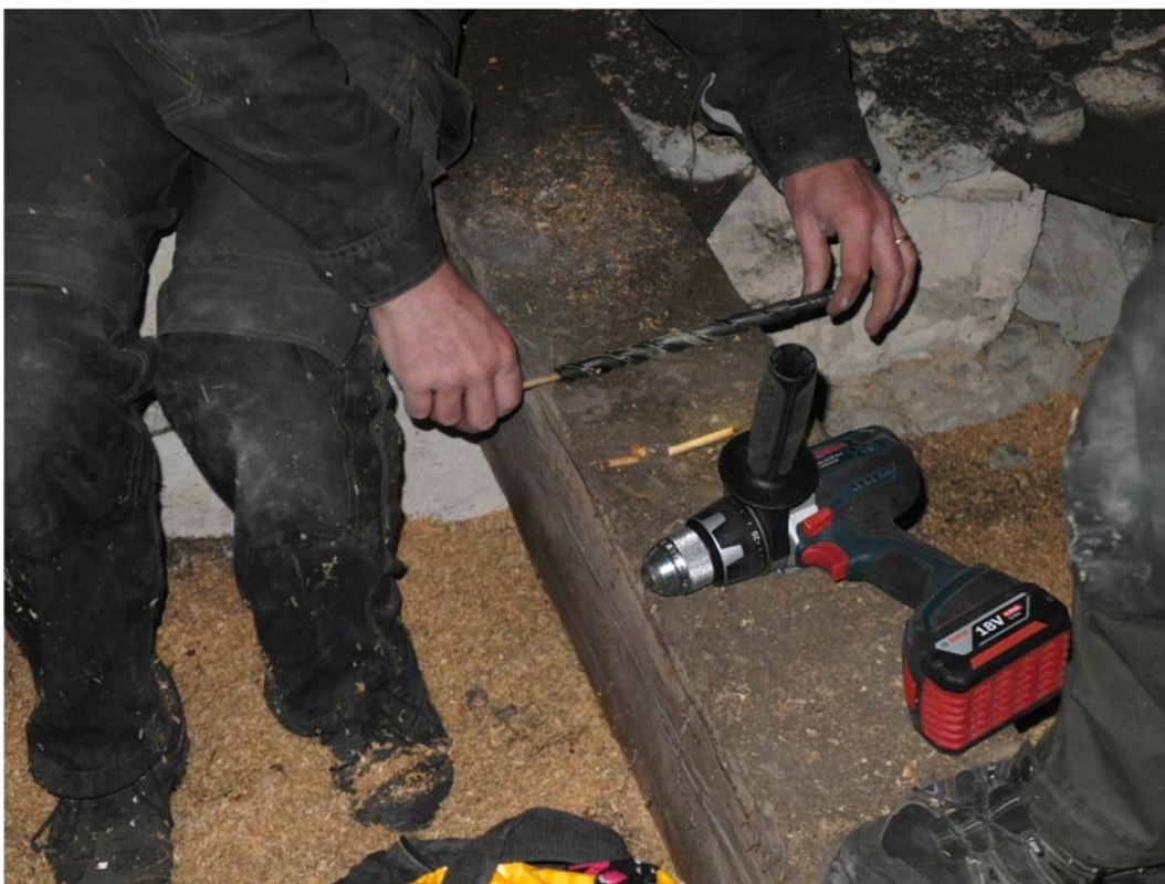
En provbit plockas försiktigt ur borren.