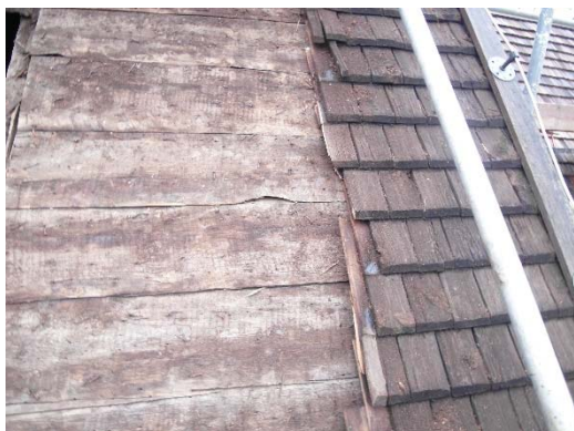
Rivning av spånet på södra takfallet.

Samtliga takfall på kyrkan har täckts med nytt stavspån och tjärats. Även klockbodens spåntak tjärades. Nya takspån är spjälkade furuspån från Hälsinge Takspån AB och tjäran är Furutjära 850 från Auson tillsatt med 15 % rå, kallpressad linolja från Egedahl i Svanshals. Nya vindskivor, nockbrädor och vattbrädor av furu kommer från Eka Skog AB i Aneby.