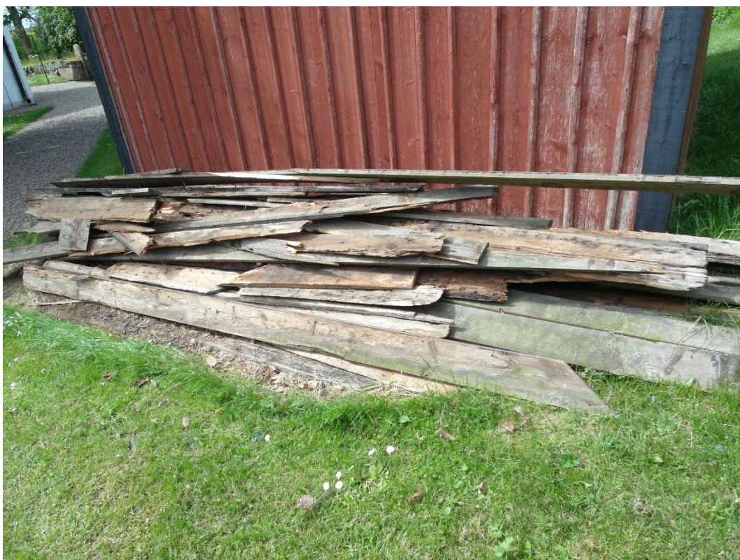
Utbytt virke, bl a vindskivor.